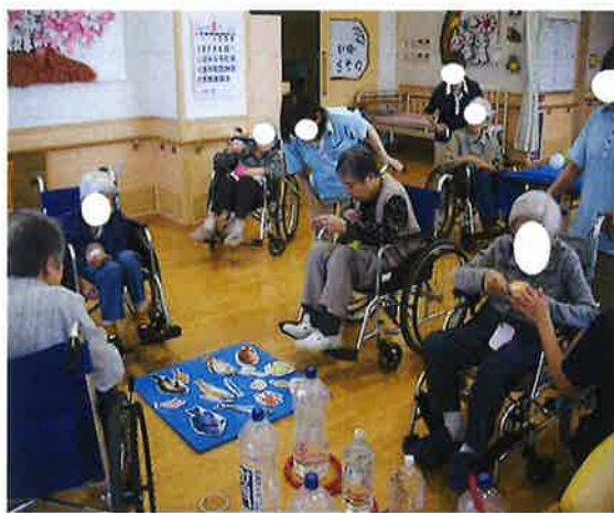
○ 8月 夏祭り