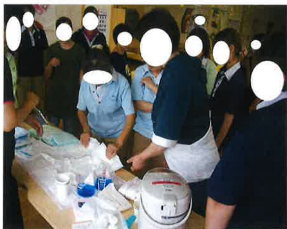
○ 8月 施設内研修【オムツ】