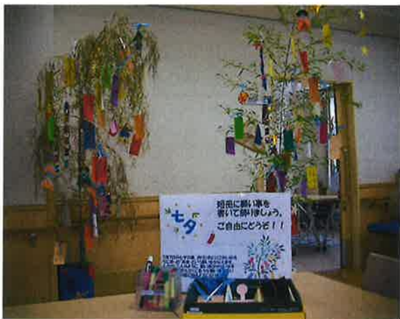
○ 7月 七夕飾り