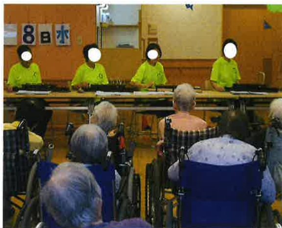
○ 8月 ボランティア【大正琴】